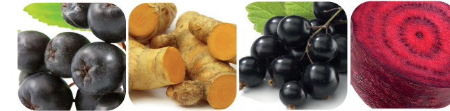
Aronia Kurkumin Svarta vinbär Rödbeta