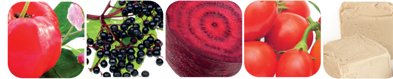
Acerola Fläderbär Rödbeta Gojibär Betaglukan