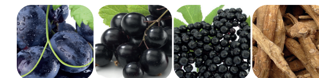
Blåbär Svartvinbär Svartvinbär Kurkumin