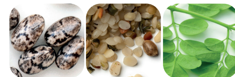
Chiafröolja Hampfröolja Moringafröolja Moringa