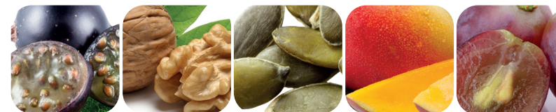
Olja från svartvinbärskärnor Valnötolja Pumpafröolja Mango Druvkärnor