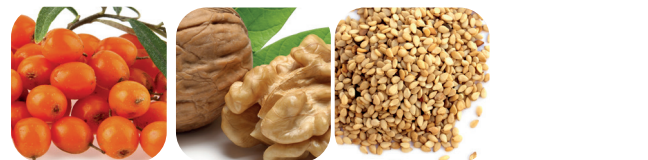
Havtornsfruktköttolja Valnötolja Sesamfröolja