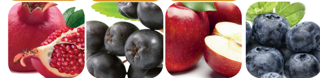
Granatäpple Aronia Äpple Blåbär