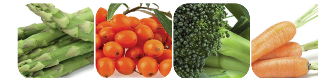
Sparris Havtorn Broccoli Morot