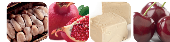
Kakaoböna Granatäpple Betaglukan Surkorsbär