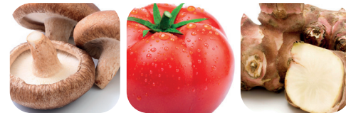
Shiitake svamp Tomater Jordärtskocka Kronärtskocka