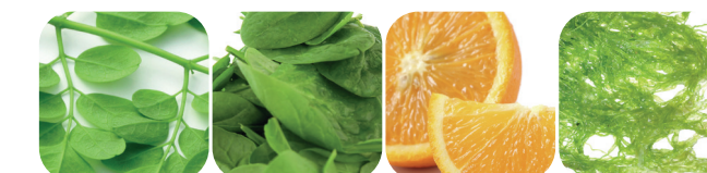
Moringa Spenat Apelsin Spirulina