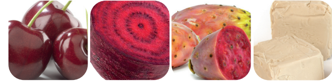
Surkorsbär Rödbeta Kaktusfikon Betaglukan