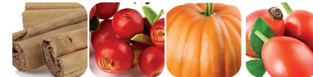
Kanel Tranbär Pumpa Nypon