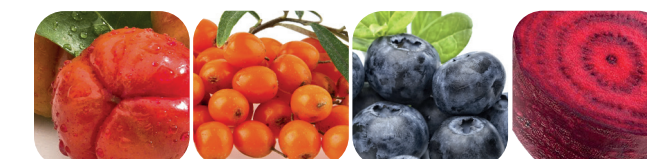
Acerola Havtorn Blåbär Rödbeta