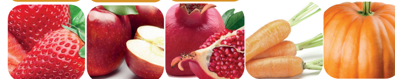
Jordgubbar Äpple Granatäpple Morot Pumpa