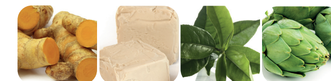
Kurkumin Betaglukan Grönt te Kronärtskocka